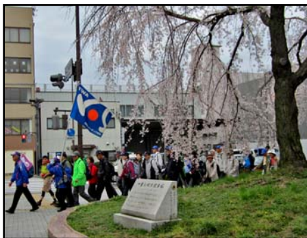
一重白彼岸枝垂桜(JR二条駅)

参加費: 会員無料 他協会300円 一般500円 ★先着500名様にシリーズバッジを進呈