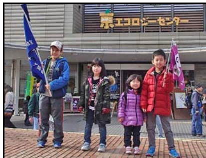
センター前広場にて

ボランティアの方たちの案内で地球環境に関する展示物を見学し、環境の大切さを勉強しました。